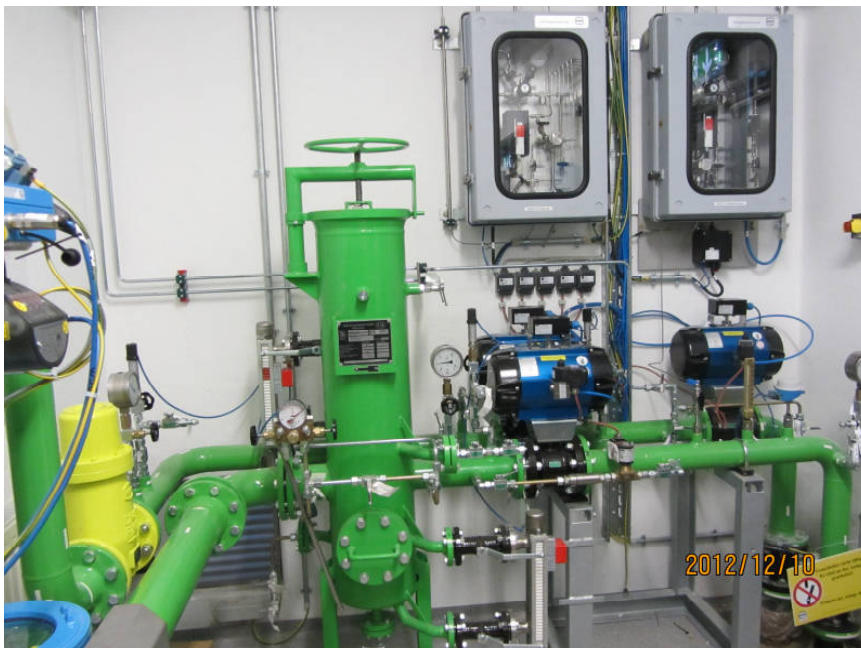
Anlageneingang mit Armaturen, Probeentnahme und Staub- Flüssigkeits- Abscheider