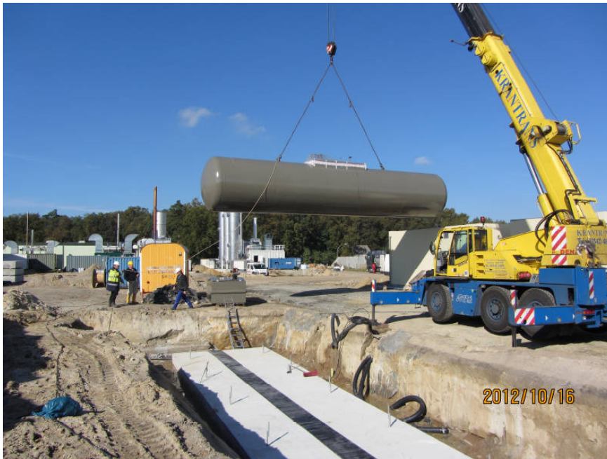
Einlagerung des Flüssiggastanks (62 m 3 , 28,7 t)

Planung und Bauüberwachung für die BGEA Schöllnitz im Auftrag von SpreeGas