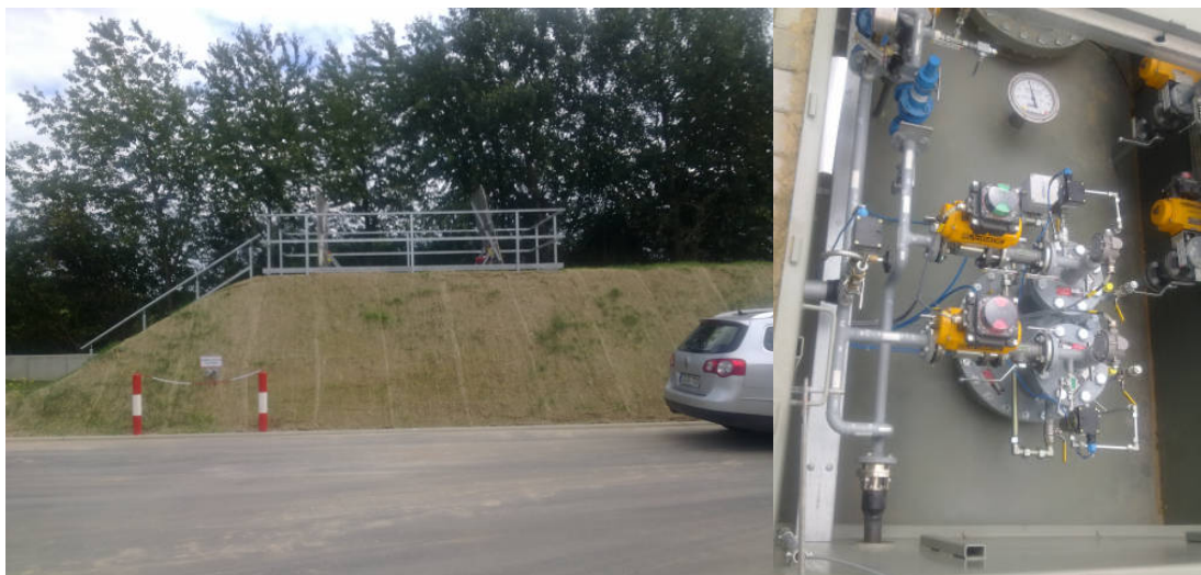
Flüssiggastankanlage für BGEA

Studie zum Anschluß der BGA Senftenberg im Auftrag von SpreeGas, 7,2 km HDL DN 100 DP 25